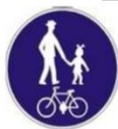
C12 – Cestička pre chodcov a cyklistov (zmiešaná prevádzka)