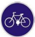
C8 - Cestička pre cyklistov