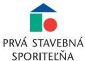
Prvá stavebná sporiteľňa, a.s.