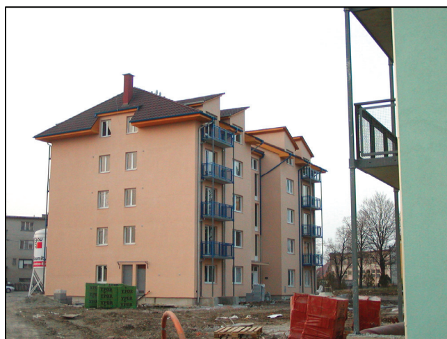
Celkový pohľad na hotové lodžie Overall view of completed loggias

Realizácia na bytových domoch v Ivanke pri Nitre preukázala reálnosť výroby a montáže predsadených lodžií z oceľovej konštrukcie. Architektonické riešenie (pôdorysné usporiadanie, materiál) pre každý jednotlivý prípad je možné meniť, resp. prispôsobiť k okolitej zástavbe a architektonickému návrhu.