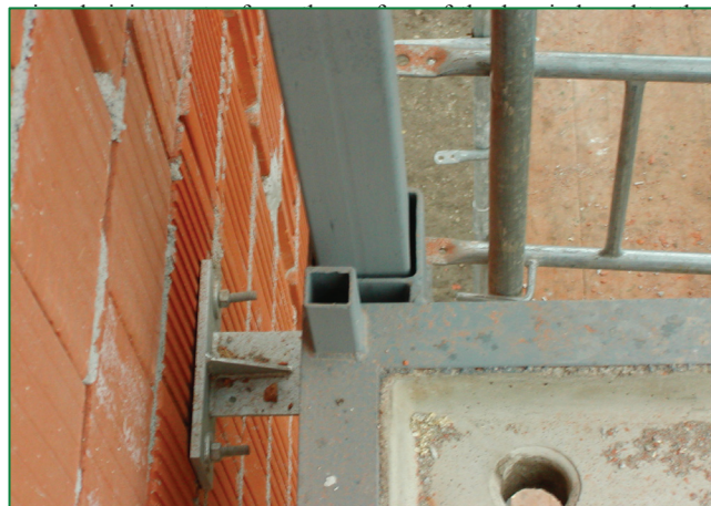
Detail spojenia stĺpikov a kotvenia zábradlia Detail of connection of columns and anchorage of railing

The mesh is welded to the frame and filled with B 20 concrete with agent XYPEX in an inverted position (production with flooring area face down); i.e., the floor space form is surface resistant against atmosphere effects and mechanic stress. There is an orifice in the concrete for connection to the waste