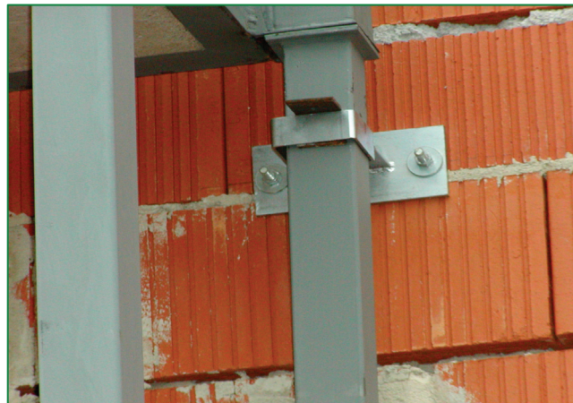
Detail kotvenia stĺpika lodžie Detail of anchorage of loggia column

In cooperation with the Municipal Office in Ivanka pri Nitre, new dwelling houses under construction, “2 x 19 flat units in Ivanka pri Nitre,” were selected to verify the implementation of protruding loggias. The pilot project was aimed at verifying the production and assembly of protruding metal loggias in the construction of these dwelling houses in Ivanka pri Nitre. These loggias have an independent structure which allows them to protrude from existing buildings or from new buildings.