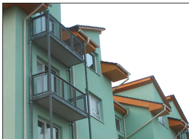
Detail ukončenia lodžií pri streche Detail of finishing of loggias at the roof

The implementation on the residential buildings in Ivanka pri Nitre showed the feasibility of the production and assembly of protruding loggias from a steel structure. The architectural solution (plan arrangement) for individual cases can be altered or adapted to meet differing ambient constructions and architectural proposals.