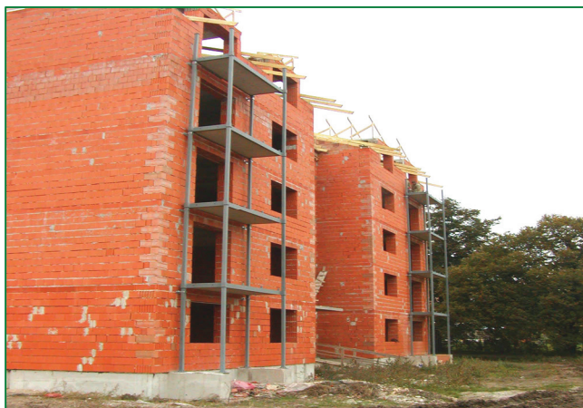
Pohľad na bytový dom počas montáže lodžií View of the apartment building during the assembly of loggias

V spolupráci s Obecným úradom v Ivanke pri Nitre sa na overenie realizácie predsedaných lodžií vybrala výstavba nových bytových domov „2 x 19 b.j. v Ivanke pri Nitre“. Cieľom realizácie pilotného projektu bolo overenie výroby a montáže predsedanej kovovej lodžie na výstavbe nového bytového domu v Ivanke pri Nitre. Navrhovaná lodžia má samostatnú konštrukciu a umožňuje predsadenie k existujúcej alebo novej budove.