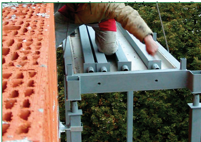
Montáž stropnej dosky na stĺpiky Assembly of ceiling board on columns

Na rám sa privarí sieťovina a vyplní sa betónom B 20 s prísadou XYPEXu v obrátenej polohe (výroba podlahovou plochou nadol) tak aby podlahová plocha tvorila povrch odolný proti pôsobeniu atmosférických vplyvov a mechanickému namáhaniu. V betóne je otvor pre napojenie odpadnej rúrky