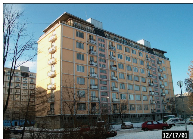
Celkový pohľad na obnovený bytový dom na Piešťanskej ul. č. 5 – 7 General view on the upgraded dwelling house LB – structural system, Piestanska Str. No 5-7

Realizácia obnovy balkónov nevyžaduje vylúčenie užívania bytov.