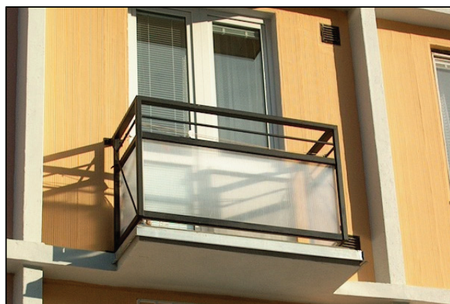
Pohľad na obnovený balkón s novým zvýšeným zábradlím ukotveným čiastočne pomocou ťahadiel do obvodového plášťa

The dwelling house is located on a flat area of the south - east slope of the Male Karpaty in Bratislava. The house was built in 1962 in LB - structional system. It is a two-sectional house with 9 storeys. 7+1 storeys are for dwelling aim and 1 storey is technical-entrance. The house is orientated by longitudinal line to the north-west side with entrances of the south-west. The staircase is communication way, a personal elevator is placed in a free space. The main building entrance passes across the closing door space. The last dwelling storey is recessed inside from the building external perimeter and the recessed storey makes a roof terrace.