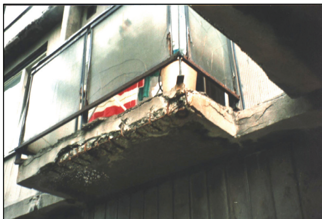
Pohľad na zdegradovaný železobetónový balkón LB realizovaný na 1. NP; rozsiahla korózia konštrukcie zábradlia, popraskaná výplň zábradlia View to the degraded steel-concrete balcony LB realised at the first storey; the large corrosion of a balcony railing; a cracked filling of rail

Budova sa nachádza v rovinatom území juhovýchodného svahu Malých Karpát v Bratislave. Jej výstavba sa uskutočnila roku 1962 v konštrukčnom systéme LB - Liaty betón. Jedná sa o 2 - sekciový dom s 9 nadzemnými podlažiami. Z toho je 7+1 obytných podlaží a jedno podlažie technické - vstupné. Dom je orientovaný pozdĺžnou osou približne na severozápad, so vstupmi od juhozápadu. Komunikačné jadro tvorí schodisko, v zrkadle ktorého je umiestnený jeden osobný výťah. Vstup do budovy je cez uzatvárateľné zádverie. Posledné obytné podlažie je po celom obvode uskokené dovnútra budovy – ustupujúce podlažie vytvárajúce po obvode strešné terasy.