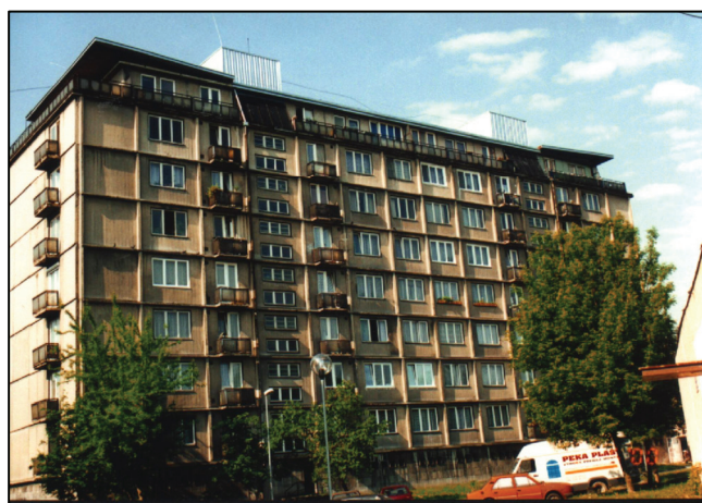
Celkový pohľad na bytový dom LB – Piešťanská ul. č. 5 – 7 General view on the dwelling house LB – structural system, Piestanska Str. No 5-7

Skutočné zhotovenie stavebných konštrukcií sa môže značne líšiť od pôvodného projektovaného návrhu.