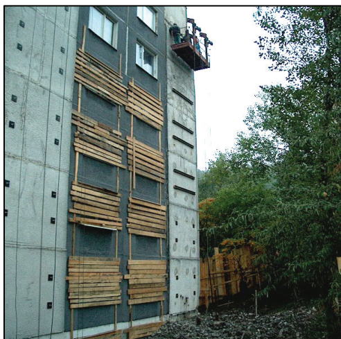
Klimaticky namáhaný náveterný štít počas odoberania obkladových panelov Climatic stressed gable wall during the taking off the facing panels

Determinate mechanical characteristics of "keramzit-concrete" facing panel parts and their physical condition made decision about process at the pilot project of taken away facing panels and their compensation by an additional contact thermal protection. The process verified also real condition of geometric configuration, anchoring and "keramzit-concrete" characteristics. Realization of safety precautions (fencing of area around the house by solid fence high 3 m, assembly anchoring of facing panels, window sheeting in forth floors) were a part of the project process.