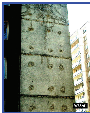
Pohľad na pôvodný stav časti severozápadného štítu View on the north-west gable wall in original shape

Failures in a beginning stage of development appear on the south-east gable wall. Additional thermal protection is capable to stop their following development.