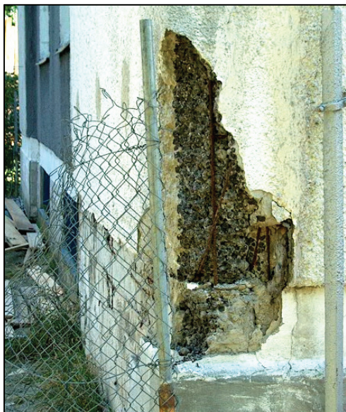
Pohľad na bočnú plochu obkladového panelu po samovoľnom odpadnutí oddelenej hmoty keramzitbetónu View on side parts of facing panel after individual fall of "keramzit-concrete" mass