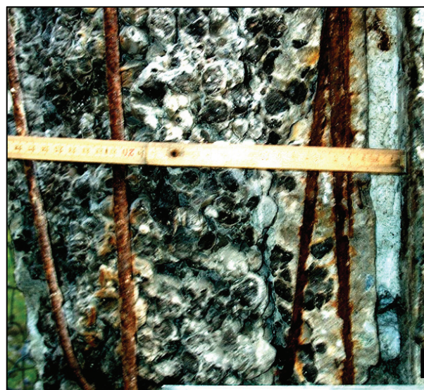
Korózia výstuže obkladového panelu po samovoľnom odpadnutí oddelenej hmoty keramzitbetónu Reinforce corrosion of facing panel after individual fall of "keramzit-concrete" mass

Predmetom pilotného projektu obnovy celopanelových budov konštrukčného systému ZT bol prieskum obvodových plášťov z keramzitbetónových obkladových dielcov z hľadiska vlastností hmoty, návrh spôsobu a overenie odoberania obkladových keramzitbetónových dielcov, spracovanie technologického predpisu a súhrnné hodnotenie, technické a technologické podklady pre odstránenie systémovej poruchy.