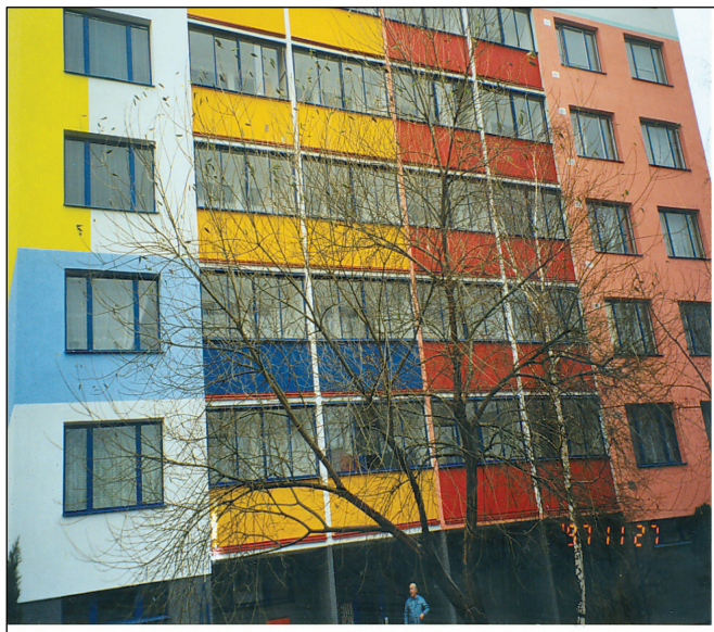
Detail nového priečelia Detail of the New View of the Facade

The wall-opening structures have been sealed with silicone sealant SILPRO that was extruded into the milled out grooves treated against rottenness and other wood decaying fungi. The contact of the frame of wall-opening structure with thermal insulation system has been sealed with silicone cement.