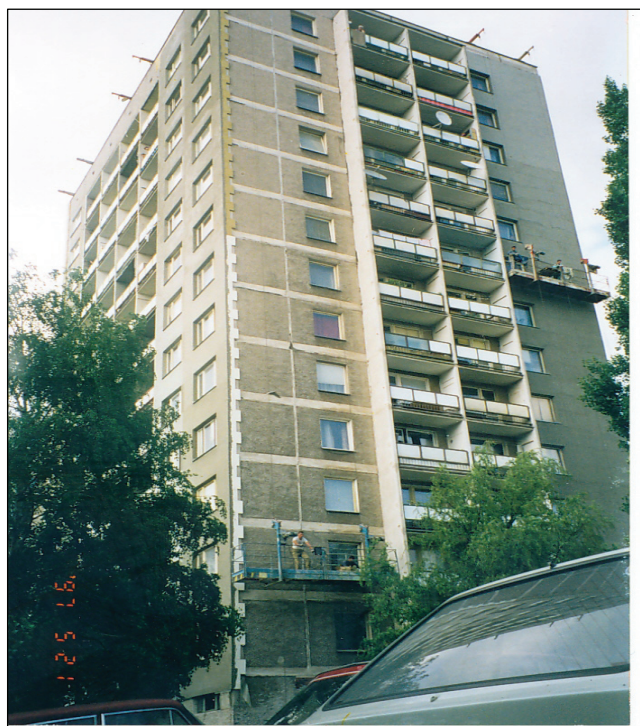
Pôvodný stav bytového domu Original Condition of Residential House

V štítovej stene sú k nosnej železobetónovej stene hr. 140 mm ukotvené obkladové panely z troskopemzobetónu TPB tr. 0 (TPB 105), s projektovanou objemovou hmotnosťou 1650 \text{ kg/m}^3 a hr. 210 mm v prvom podlaží a v