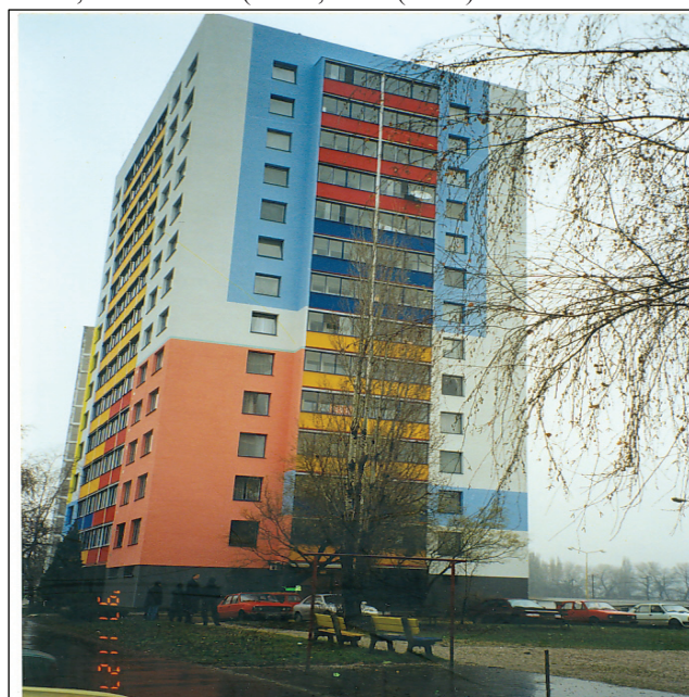
Nový stav bytového domu Condition of the Building after Refurbishment

At the gable the load-bearing iron-concrete wall 140 mm thick, holds the anchors of the lining panels from the slag-pemza concrete TPB Class 0 (TPB 105), of density 1650 \text{ kg/m}^3 and 210 mm thick on the 1 st storey and 240 mm thick on the higher storeys. The thermal resistance R = 0,551 \text{ m}^2\cdot\text{K/W} ( U = 1,39 \text{ W/(m}^2\cdot\text{K)} ).