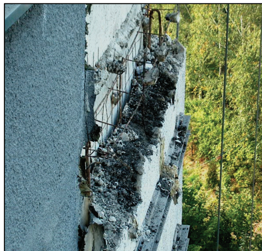
Obnažená výstuž a ukotvenie obkladových panelov Naked reinforce and anchoring of the facing panels