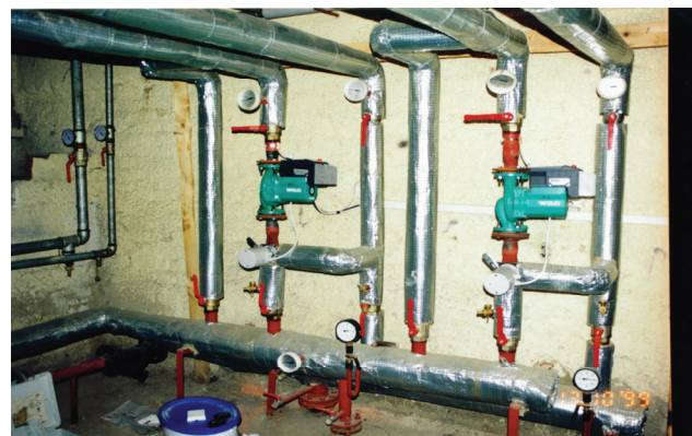
▲ Strojovňa výmenikovej stanice Machinery-room of the heat exchanger station

- replacement of installation distribution lines for gas - original distribution lines made of black steel with the threaded joints (though they didn't get over the end of their service life, but in regard of the flooding caused by users several times during the dwelling house existence, they were completely corroded in the passages through the ceiling plate) were replaced by new ones;