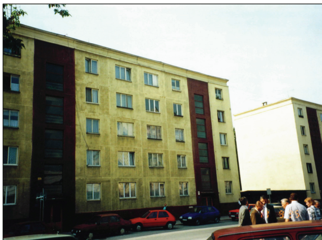
▲ Pôvodný stav bytového domu Original Condition of the Dwelling House