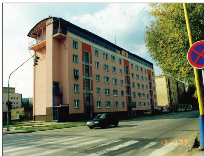
▲ Nový stav bytového domu New Condition of the Dwelling House