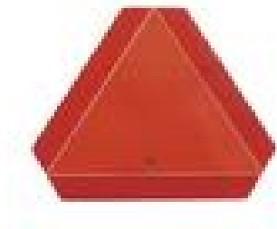
Obr. č. 1 – zadná označovacia tabuľka pre pomalé vozidlá a ich prípojné vozidlá

Montáž a umiestnenie zadných označovacích tabuliek pre pomalé vozidlá a ich prípojné vozidlá musia byť vykonané podľa predpisu EHK 69 – príloha 15 (obrázok č. 2).