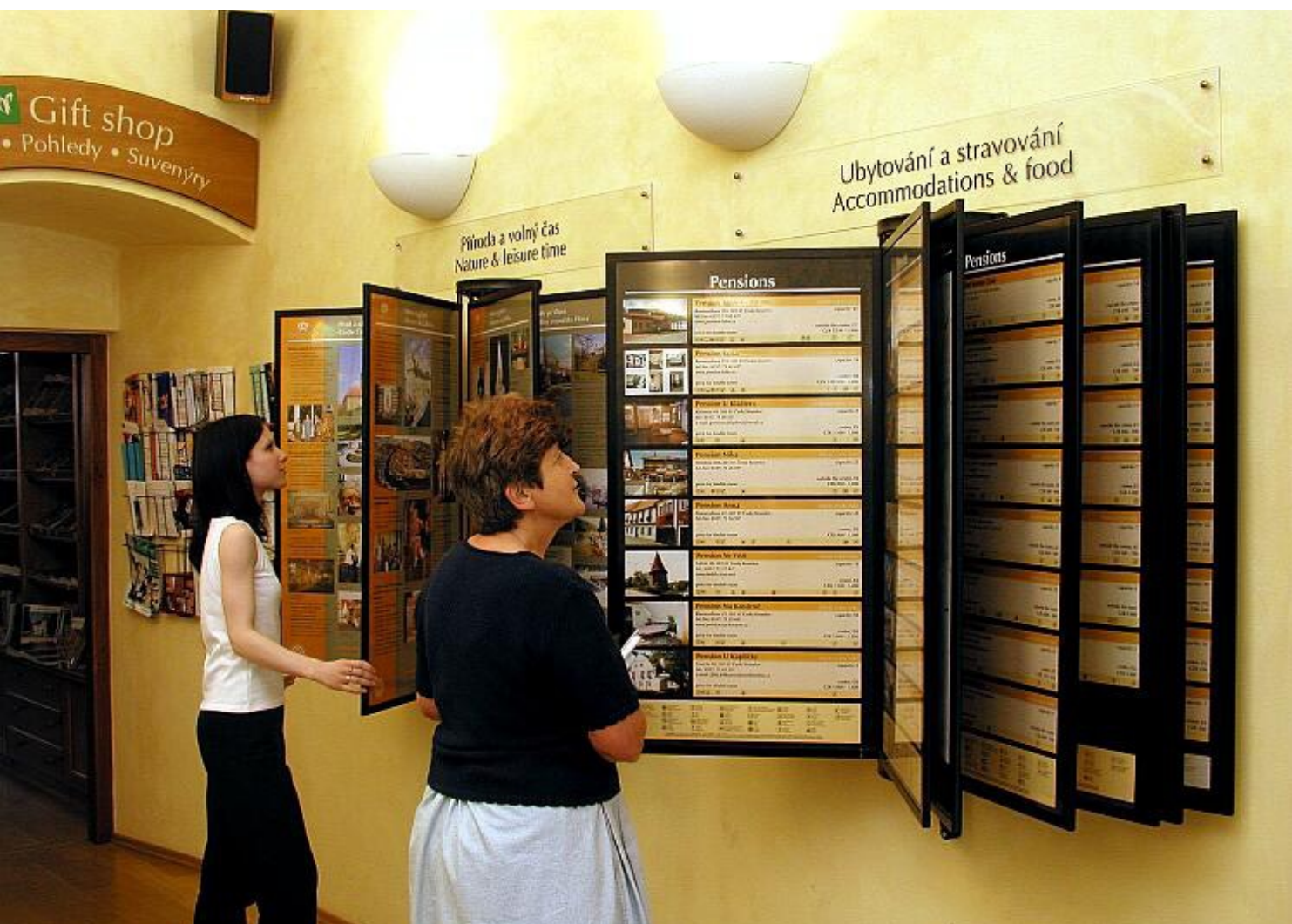
Obrázok 1: Informačné panely v Informačnom centre Český Krumlov

Aktivity destinačného manažmentu zabezpečujú 2 - 3 kvalifikovaní pracovníci s adekvátnym vzdelaním a praxou. Celý, veľmi úzko prepojený systém riadenia turizmu v meste (vrátane informačného centra a informačného systému) zamestnáva 13 stálych pracovníkov.