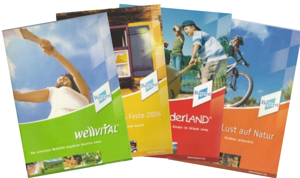
Tematické produkty destinácie Bavarsko – Cítiť sa dobre, Kultúra, Umenie a podujatia, Chuť na prírodu, Detský svet (obálky produktových brožúr)

Produktové línie sú zároveň základom pre variabilné marketingové opatrenia organizácie cestovného ruchu. Jednotlivým poskytovateľom služieb umožňujú spolupracou zapojiť sa do marketingového konceptu destinácie (tzv. akvizičné možnosti spolupráce s OCR). Čím a ako organizácie cestovného ruchu, napr. v nemeckých destináciách tieto témy naplňajú?