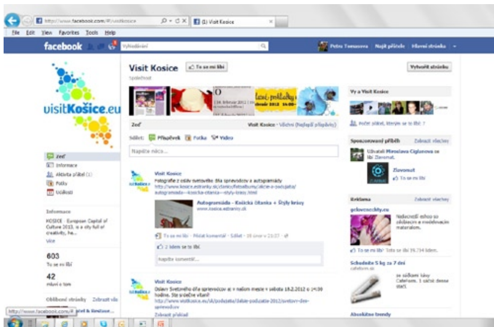
Novodobá propagácia destinácie cez elektronické médiá (sociálne siete – Facebook a informačný elektronický spravodajca – destinácia Košice)

V prílohe č. 1 uvádzame komplexný prehľad činností organizácie cestovného ruchu (OOCR, KOCR). Rozsah činností OCR v tej- ktorej destinácii však bude závisieť od celkovej rozlohy destinácie, vývojového štádia destinácie, postavenia organizácie v destinácii, vývojovej fázy organizácie a pod.